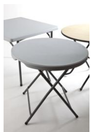
Tav. Click rotondo € 6,00 diametro cm. 81 Tav. Legno rotondo € 6,00 diametro cm. 90 Tav. Click quadrato € 6,00 cm. 91