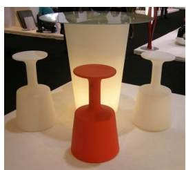
Tavolo XPot luminoso piano in vetro € 28,00 cm. 90 x 107h.