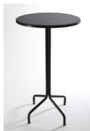
Tavolo Mangia in Piedi € 15,00 altezza cm. 115 diametro. Cm. 62