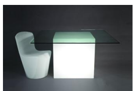
Tavolo Square piano in vetro € 45,00 cm.150 x 150 x 74h.