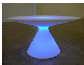
Tavolo Ed piano in vetro € 35,00 diam. 140 x 72h