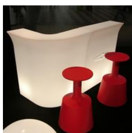
Jumbo Bar € 60,00 cm. 80 x 90 x 110h. Jumbo Corner € 60,00 cm. 80 x 90 x 110h.