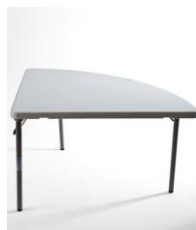
Tavolo Click Corner cm. 76 € 5,00 cm. 91 € 6,00