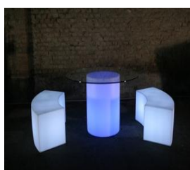
Tavolo Arthur luminoso € 28,00 cm.54 X7 2 h.