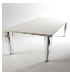
Tavolo Top Top € 50,00 cm. 160 x 80 x 72h