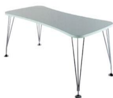
Tavolo Max bianco laminato antigraffio e acciaio cromato € 70,00 cm. 160 x 80 x 73h.