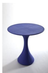
Tavolo Kissi Kissi Diam cm. 70 x 72h. € 28,00